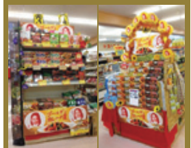
新鮮市場サカイ 田隅本店様 (福岡)