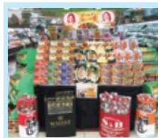
賛栄商事(株) じゃんぼ食鮮館 野崎店様 (大阪)