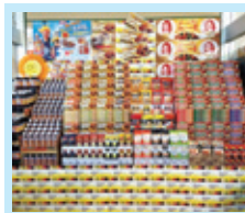
(株)タカラ・エムシー フードマーケットマム城北店様 (静岡)