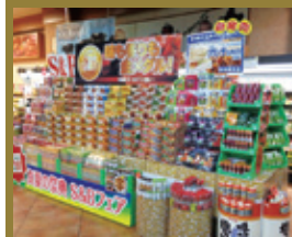
(株)エース 沼津店様 (静岡)