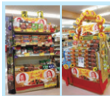
新鮮市場サカイ 田隅本店様 (福岡)