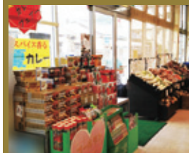
スーパーおさだ(株)様 (静岡)