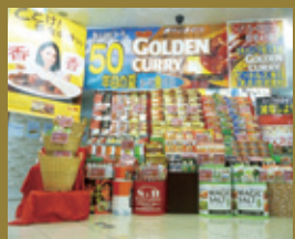
キッチンランド SUNSUN様 (京都)