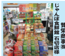
じゃんぼ食鮮館 石切店様 (大阪)