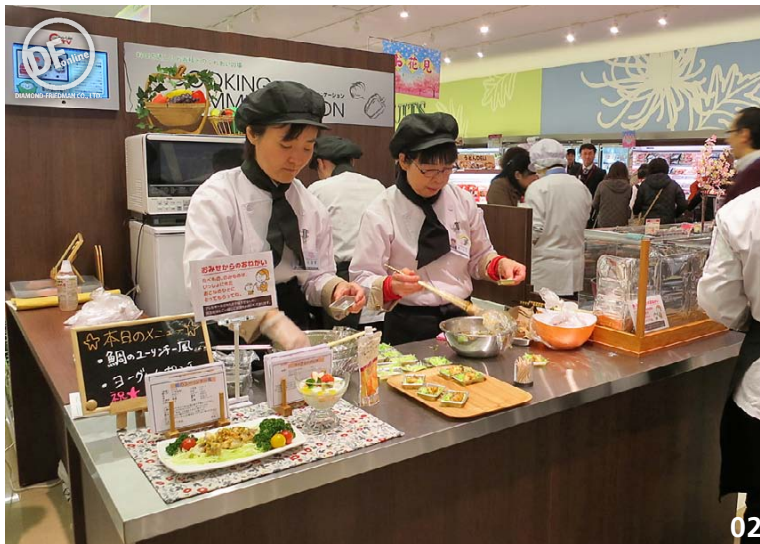
01 ワインとデリをクロス展開するアソート売場を「ワインデリ」として大きく展開 02 「クッキングコミュニケーション」では、売場のおすすめ商品を使ったメニューを提案