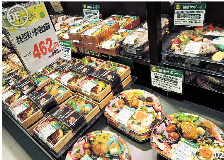
01 鮮魚売場では名古屋市場直送の魚介を対面販売で提供。えびず鯛などの高級魚も並ぶ 02 健康志向の商品が充実してる弁当類。「健康サポート」シリーズは、POPで特徴とカロリーを表示する