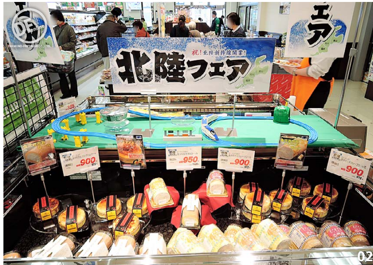
01 専用什器で展開する「冷凍フルーツ」は初導入。フルーツポンチソースとともに試食販売を実施 02 北陸新幹線開業を記念した「北陸フェア」。北陸メーカーのスイーツをアピールする