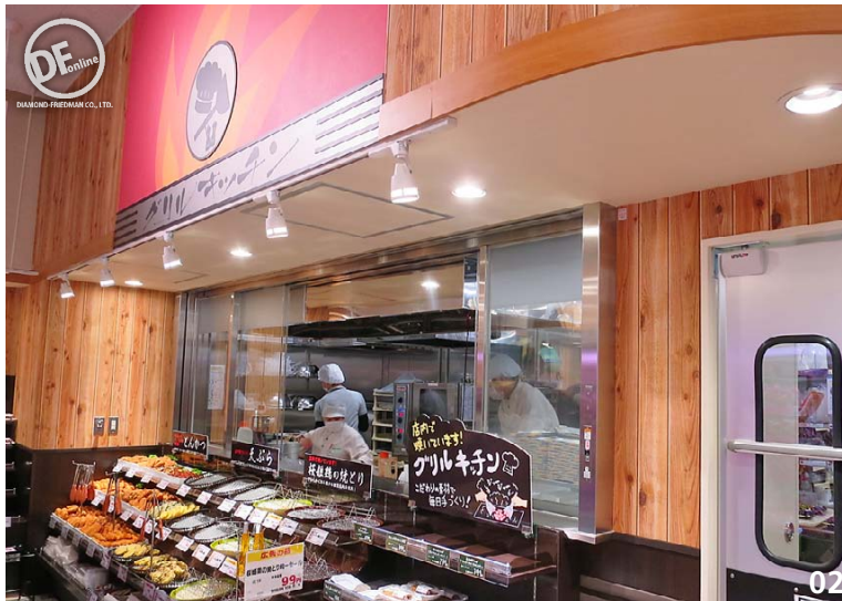
01 同店開店で同社の店舗総数は111店舗。試飲コーナー「おためし下さい」の設置店舗は27店舗目となる 02 肉惣菜を提供する「グリルキッチン」は、作業場を惣菜と共有する小型店仕様