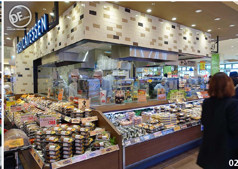
01 2層吹き抜けの構造に、同店で初めてエスカレーターを中央に配置。その隣にイトインスペースを設けている 02 売場中央に配置された惣菜のセントラルキッチン。ライブ感あふれる演出を行う