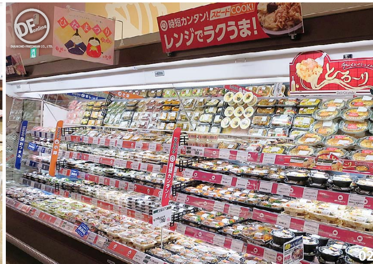
01 イートインスペースには、淹れたてのコーヒーと紅茶が楽しめるマシンを設置。ホット、アイスとも93円(税別) 02 レンジアップ商品各種を豊富に品揃え。各売場で簡便商品を積極的に展開