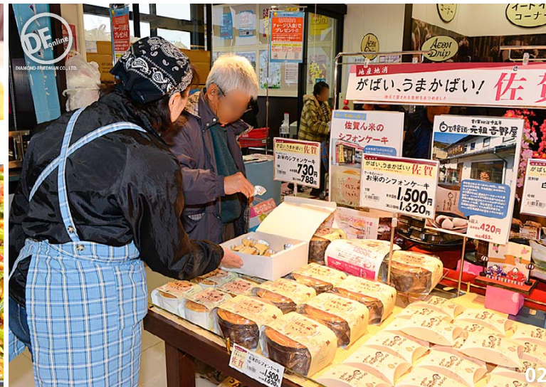
01 惣菜やサラダを必要な量だけ買いやすいバイキングスタイルで提供 02 方言を効果的に使ったPOPで地元産の食材や加工品を効果的にアピール