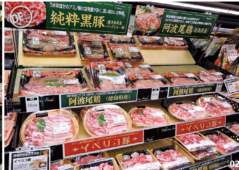
01 季節感あふれる春いちごを大量展開する「STRAWBERRY Marche」 02 各地のブランド肉を取り揃えた精肉コーナーはボードで特徴をアピール