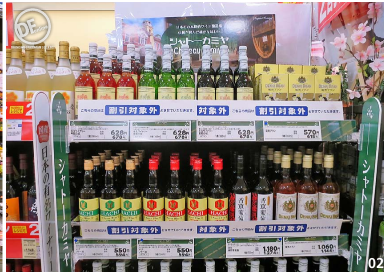
01 容器のままレンジアップできる惣菜を取り揃え。関連商品としてレンジで魚が焼ける皿も紹介 02 各売場で、牛久市や茨城県産の商品を積極的に展開。牛久ワイナリーの商品も揃える